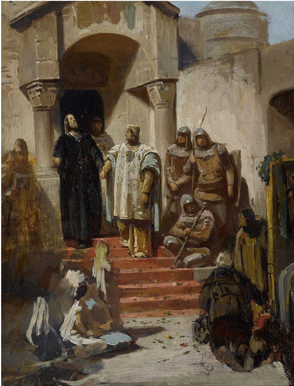
Öl auf Leinwand 61,5 x 47,5 cm, 1855–1860, in deutscher Privatsammlung

Winckelmann Akademie für Kunstgeschichte München