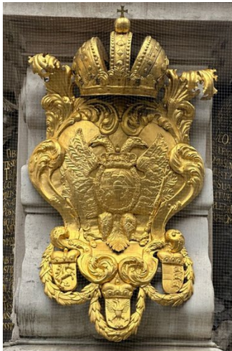
Österreich mit dem Doppeladler

Die Dreipersonlichkeit Gottes wird in Analogie zu den drei Staaten Österreich, Böhmen und Ungarn gesetzt, die das Reich der Habsburger bildeten. (Abb. 4) Leopolds I. Vater, Ferdinand III., hatte 1648 den Frieden von Osnabrück und Münster geschlossen: Selbständiges Bündnisrecht der deutschen Fürsten; Frankreich wird Schutzherr der deutschen Fürsten; die Wahl des Sonnenkönigs zum Deutschen Kaiser ist damit denkbar. Die Idee des Heiligen Römischen Reiches Deutscher Nation verblasst. Das zentrale Problem des Vielvölkerstaates Österreich war die Einheit in der Vielheit und der Versuch, den scheinbaren Widerspruch einer Einheit in der Vielfalt nach dem Beispiel der Dreifaltigkeit zu lösen (Coudenhove).