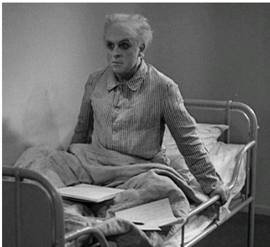
Abb. 6 Fritz Lang, Das Testament des Dr. Mabuse, 1932, Standphoto

Sucht man nun am Ende der Untersuchung ein zeitgemäßes Sinnbild für die von den einzelnen Autoren geschilderten Krankheits-, Verfalls- und Degenerationstendenzen, dann findet man in Fritz Langs berühmter Filmfigur des Dr. Mabuse deren perfekte Personifizierung. 159 Dieser geniale und zugleich wahnsinnige Psychoanalytiker entspricht jener Vorstellung von »genio-follia-degenerazione«, wie sie Cesare Lombroso in seinen Schriften aus der zweiten Hälfte des 19. Jahrhunderts wiederholt zum Ausdruck brachte (Abb. 6). 160