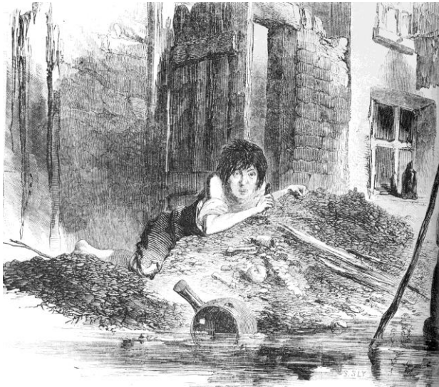
Abb. 1 „Condition of the poor“, in: Pictorial Times, Bd. VIII, 1846, S. 225

»Scheußlichkeit«, die in den englischen Arbeitervierteln aus der Mitte des 19. Jahrhunderts eine menschenunwürdige Lebensatmosphäre erzeugte (Abb. 1). 39